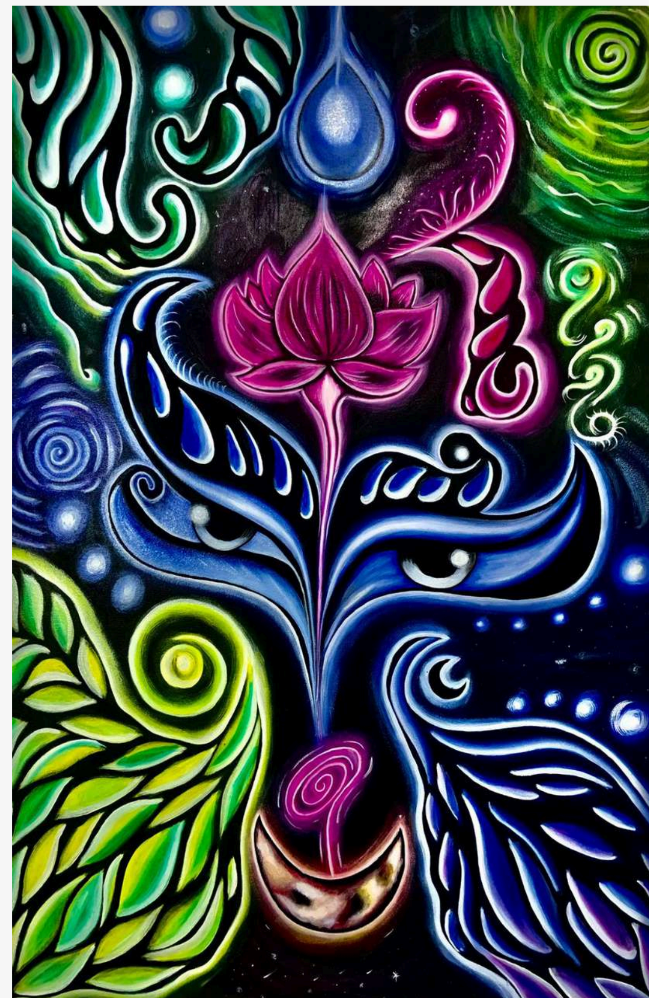
Dama da noite - 2024

Nasce da conexão com o desconhecido, com o mundo espiritual. Minhas obras emergem de sonhos, visões, meditações e intuições. Cada pincelada é um mantra visual, uma prece que busca unir o humano ao divino. Através da arte, procuro transcender a mim mesma, buscando um sentido mais profundo para a existência.