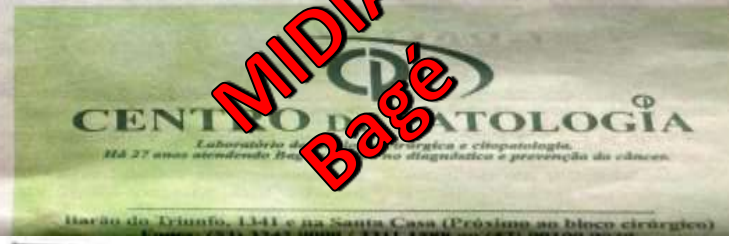
Barão do Triunfo, 1341 e na Santa Casa (Próximo ao bloco cirúrgico)

A obra, que representa a marcante presença da Espanha na capital dos gaúchos, é uma dupla homenagem, já que enaltece a celebração dos 250 anos de Porto Alegre. A abertura foi terça-feira, 29 de novembro, e a visitação vai até o dia 22 de janeiro, das 9h às 12h e das 13h30 às 17h. A entrada é gratuita.