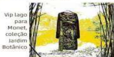
Vip lago para Monet, coleção Jardim Botânico