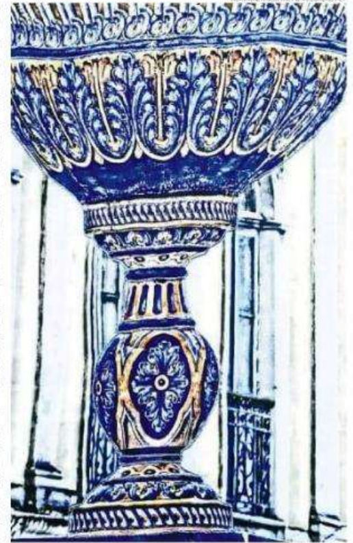
Obra 'Reciprocidade' de Jeannine Kriskke que será exposta a partir de hoje

O monumento Fonte de Talavera de la Reina foi concebido e inaugurado com discurso de Fernando Corona, com desenho e execução pelo ceramista tala-