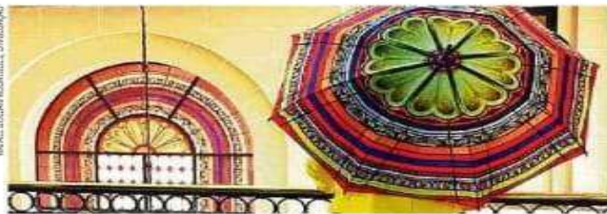
Formas e cores de vitrais como inspiração

Serão exibidas as pesquisas e experimentações da artista simultâneas à Pop Up Art Wear Store (de 22 março a 2 de abril). Em destaque, peças assinadas da coleção da Grife da AATSP irão surpreender com detalhes do belíssimo prédio e da própria sala expositiva transformados em echarpes, ergodresses, scarfresses, sombrinhas e ecoshoppers. Também será realizado o lançamento da Coleção Porto Alegre edição 2023, alusiva à Semana de Porto Alegre, com novas