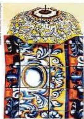
Grafismo da Fonte Talavera, em sombrinha