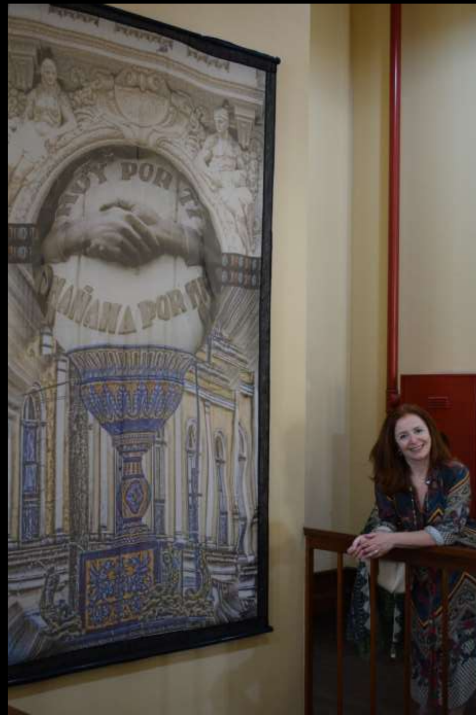
RECIPROCIDADE Painel têxtil 3D