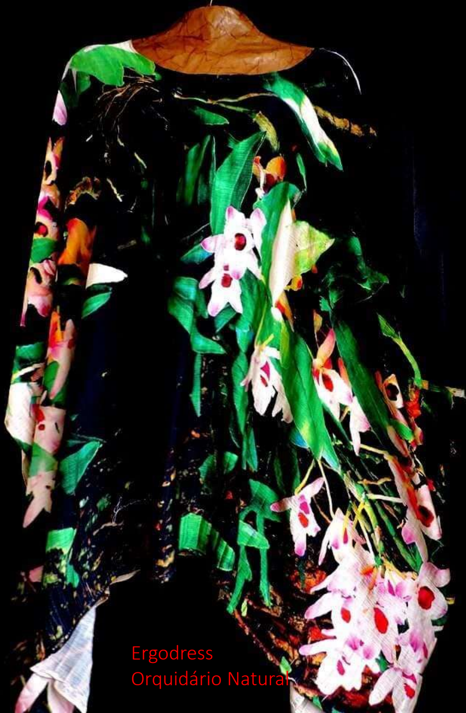
Ergodress Orquidário Natural