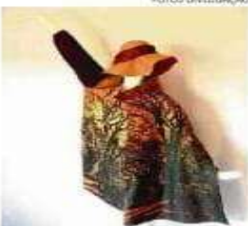
Coleção Jardim Botânico

estampas inspiradas em icônicas edificações da Capital e novas sombrinhas exclusivas.