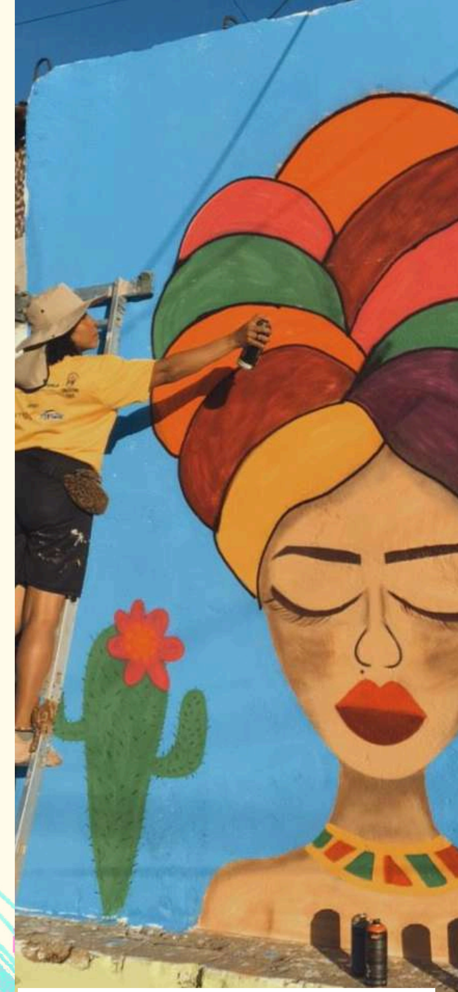
Festival GraffGesso (2023)