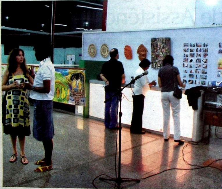
A exposição possibilita um interessante diálogo entre textos, imagens e objetos em torno da questão urbana

A sede da Regional Barreiro fica na rua Flávio Marques Lisboa, 345, 3º andar, Barreiro.