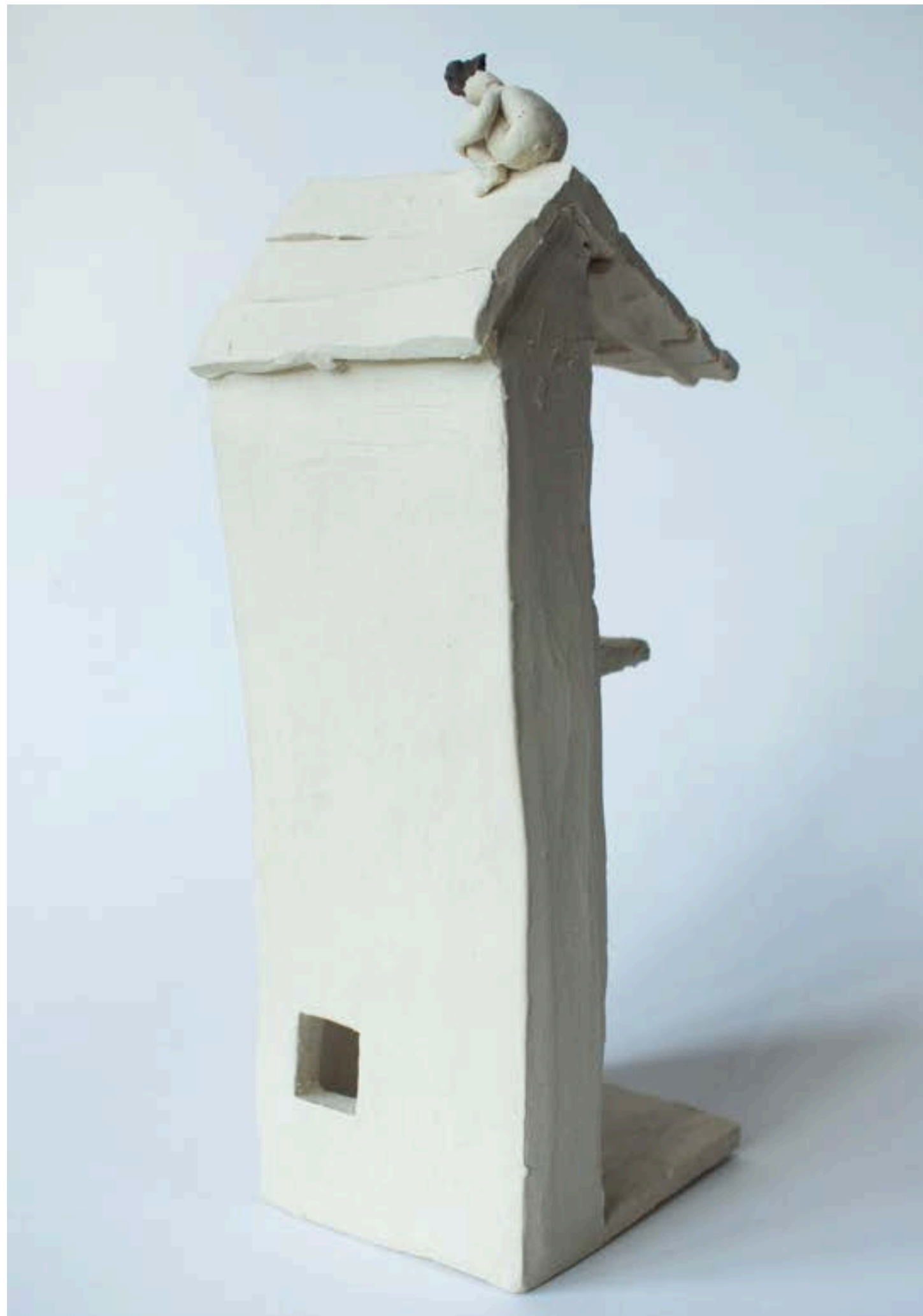
A casa 2023 Escultura cerâmica 25x5x6cm