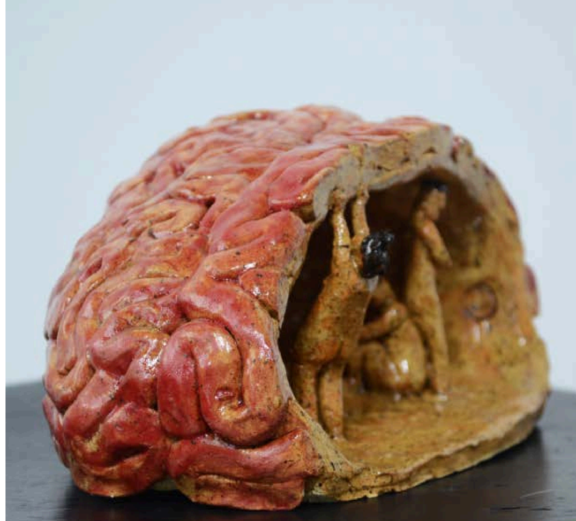
Ser cérebro 2022 Escultura cerâmica 19x10x12cm