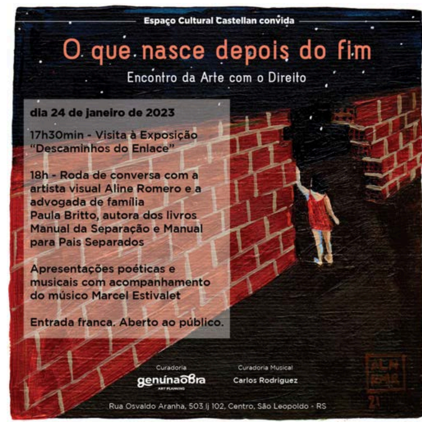
Convite exposição individual no espaço Castellan, São Leopoldo - RS.