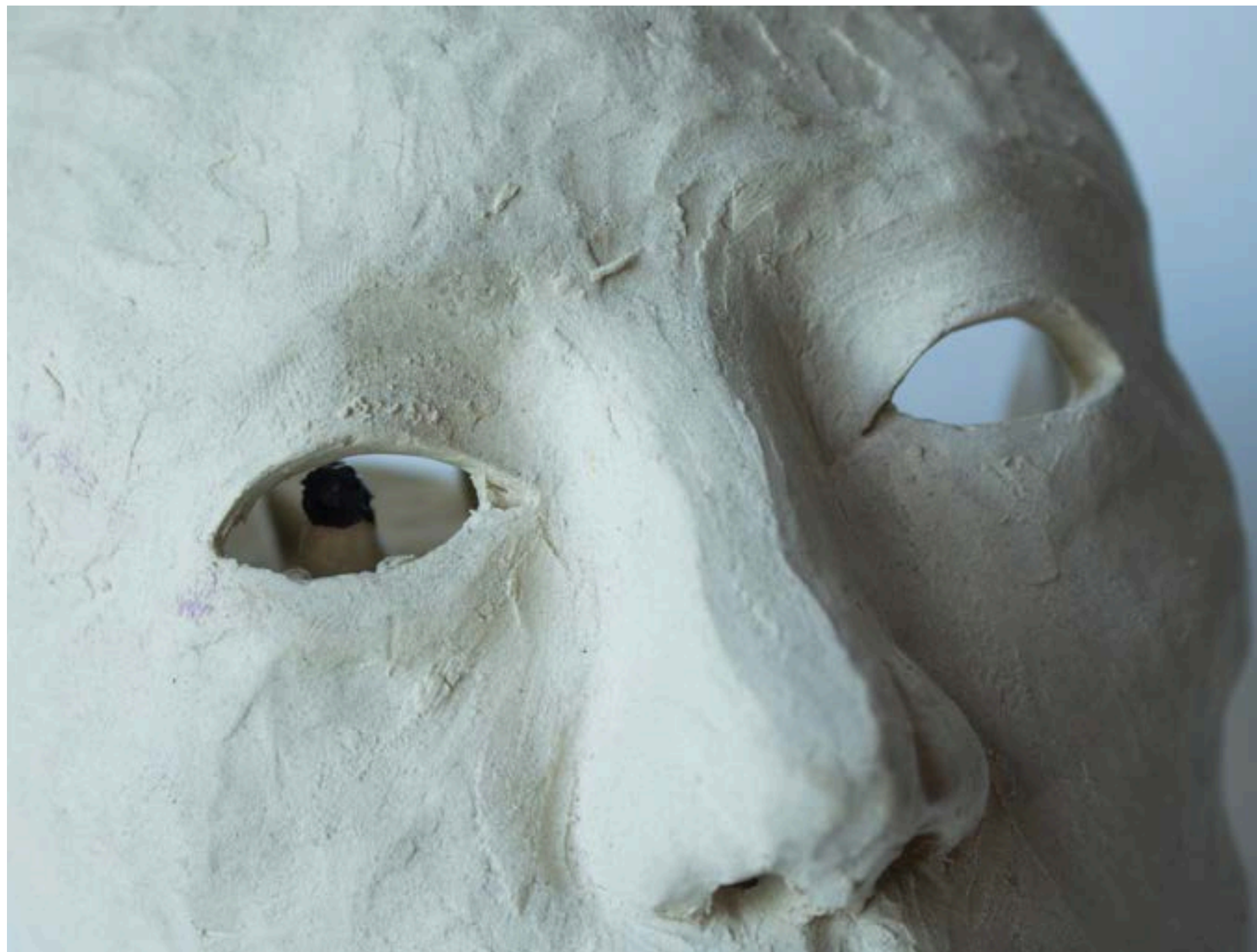
Na cabeça 2023 Escultura cerâmica 15x11x9cm