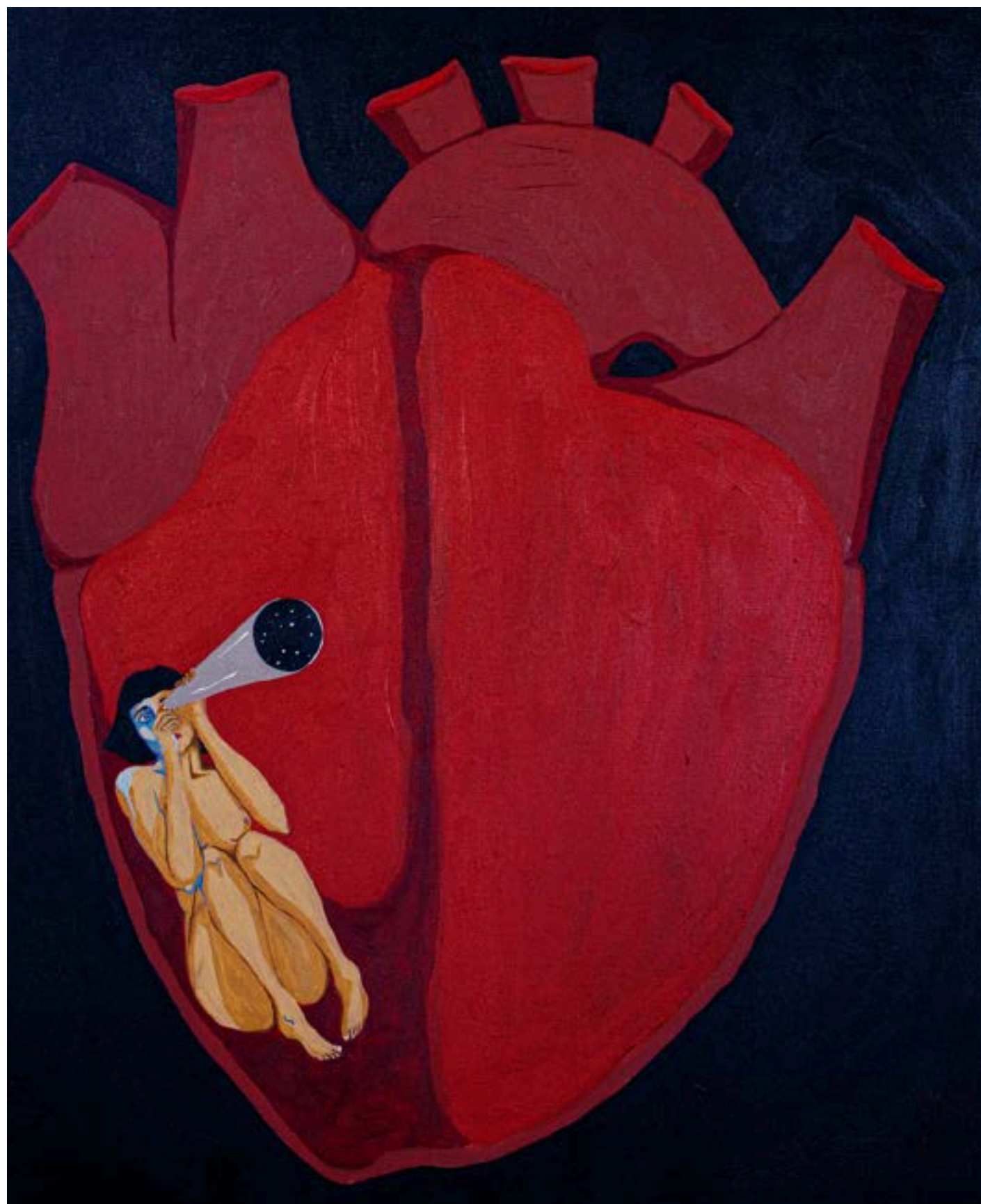
(Pro) curar 2021 Acrílica sobre tela 80x70cm