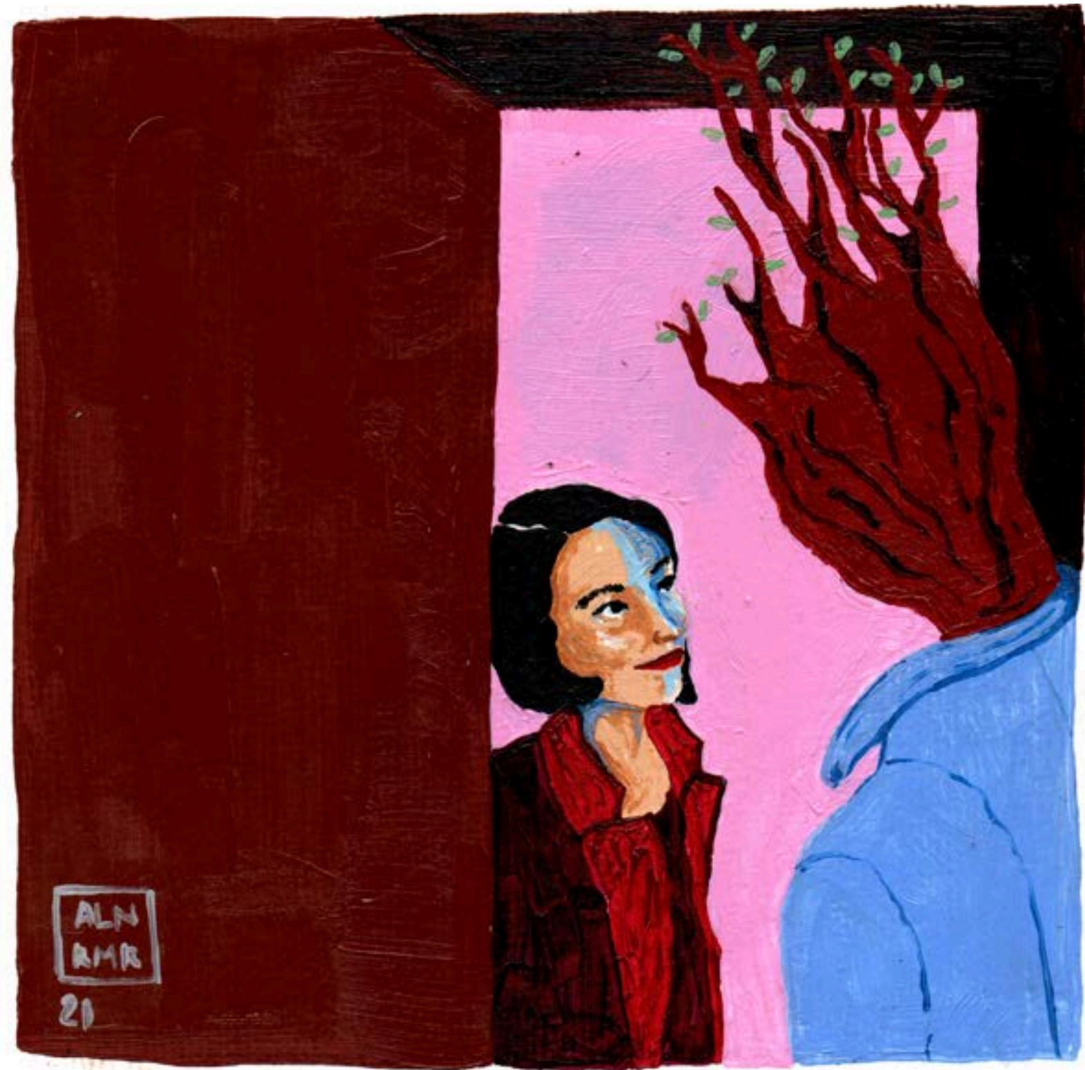
Ex Imir 2021 Acrílico sobre tela 20x20cm