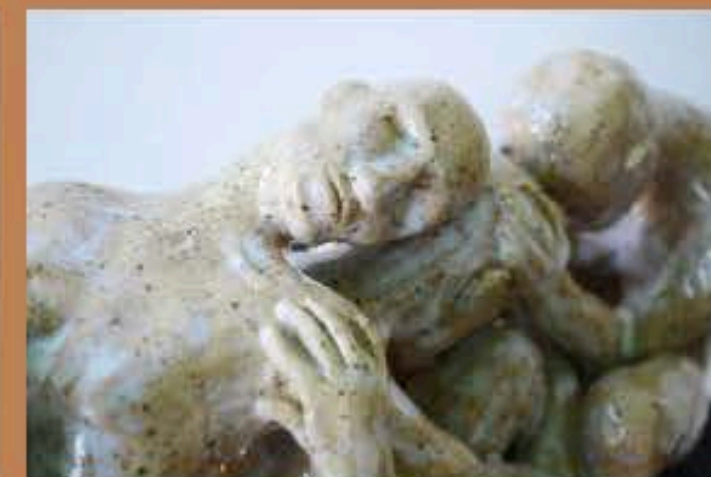
Nós (bem amarrados). 2022. Escultura cerâmica. 28x10x15cm