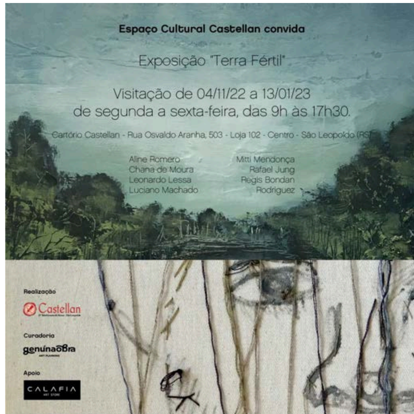
Convite exposição coletiva no espaço Castellan, São Leopoldo - RS.