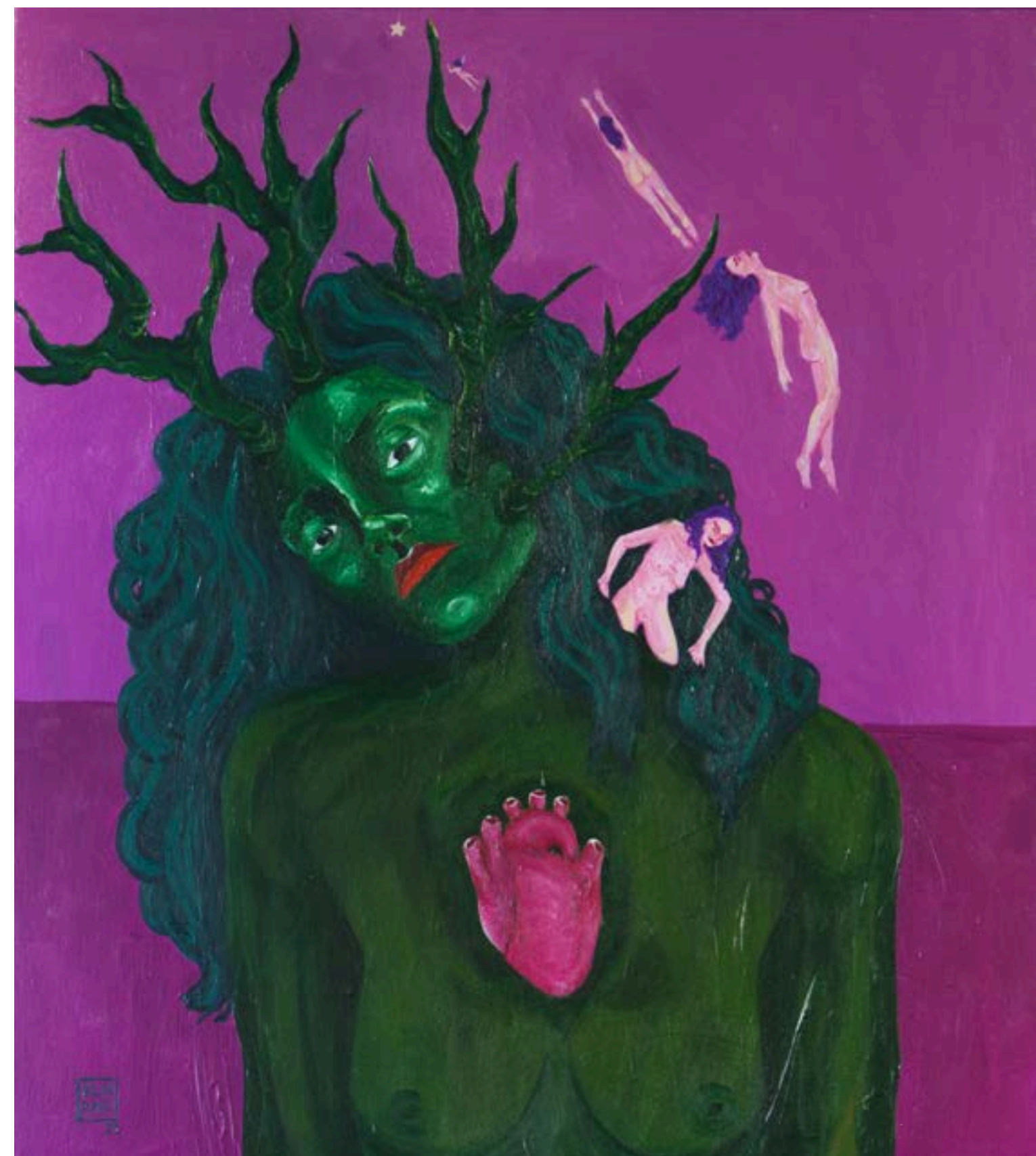
Sem título 2022 Acrílica sobre tela 80x70cm