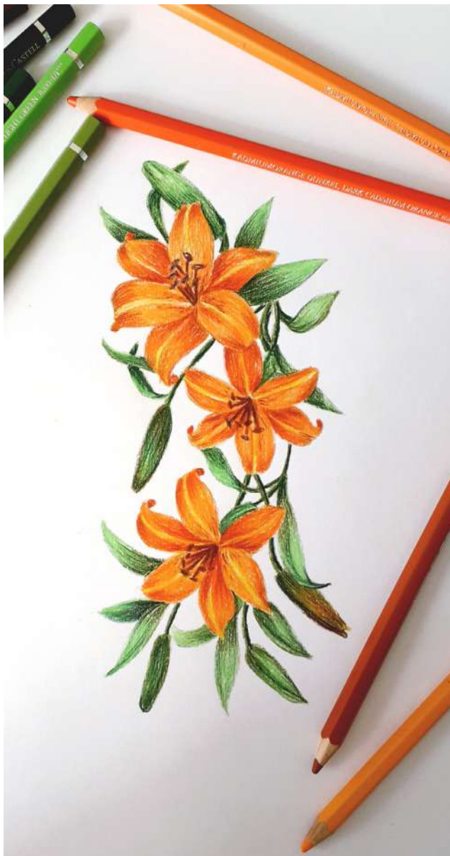
ilustração tradicional, com lápis de cor