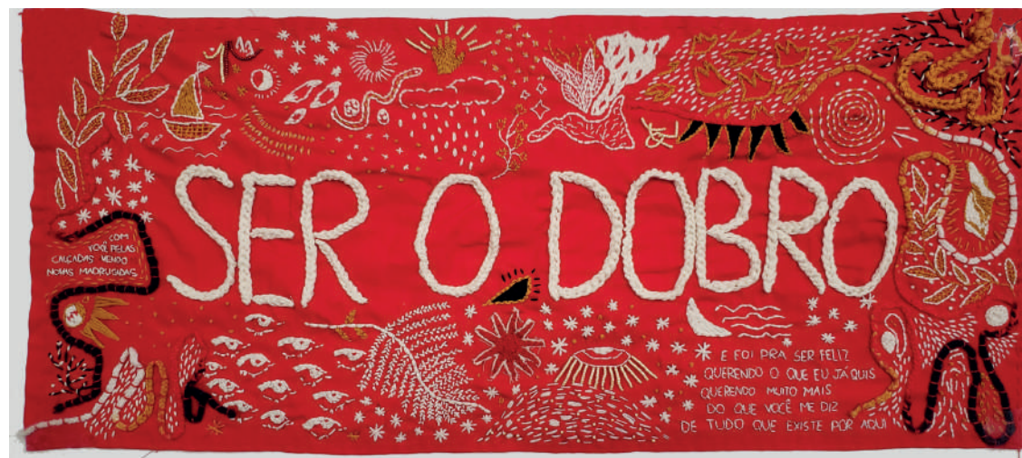
“viva muito viva” “ser o dobro” “vamos refazer o mundo” 2021 80 cm x 1,20 cm faixas bordadas