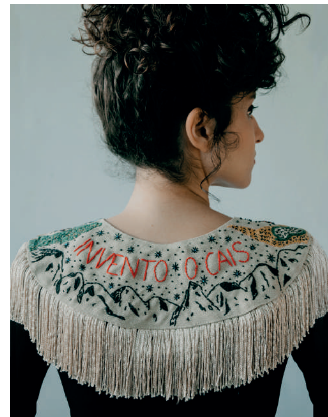
"invento o cais" 2022 gola bordada