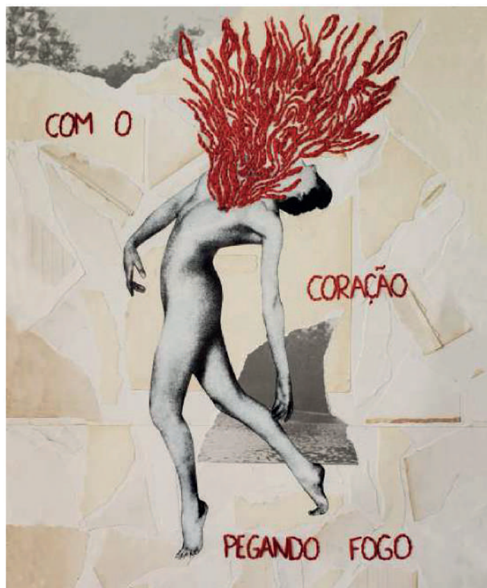
"pegando fogo" 2022 47 cm x 33 cm bordado s/ papel