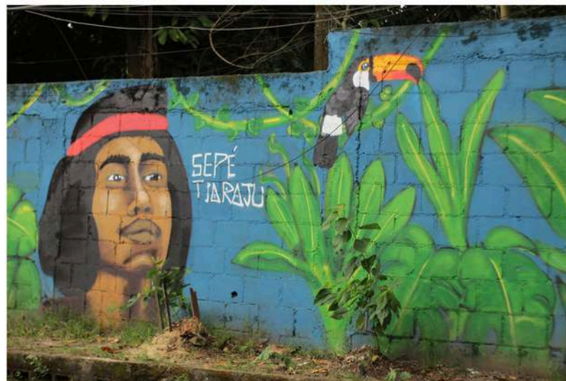
Liberdade Preta, Passado e Futuro - Construção do mural