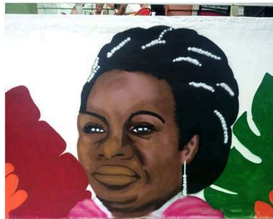
Jovelina Pérola Negra