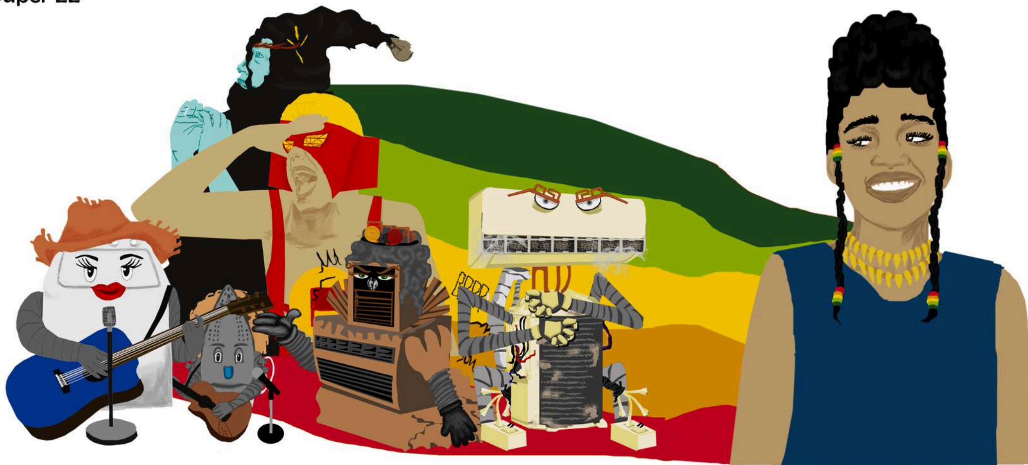
SUPER EE CONTRA O FANTASMA DO APAGÃO E SEU FIEL ESCUDEIRO BANDEIRA VERMELHA