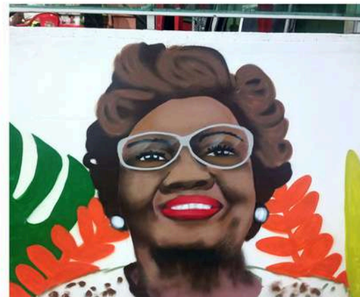
Dona Ivone Lara