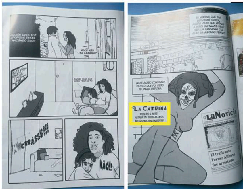
Bienal do Livro 2017