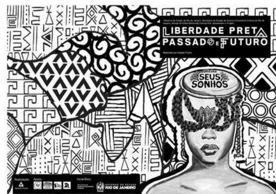
Projeto "Liberdade Preta, Passado e Futuro" aula Folheto "Seus Sonhos"