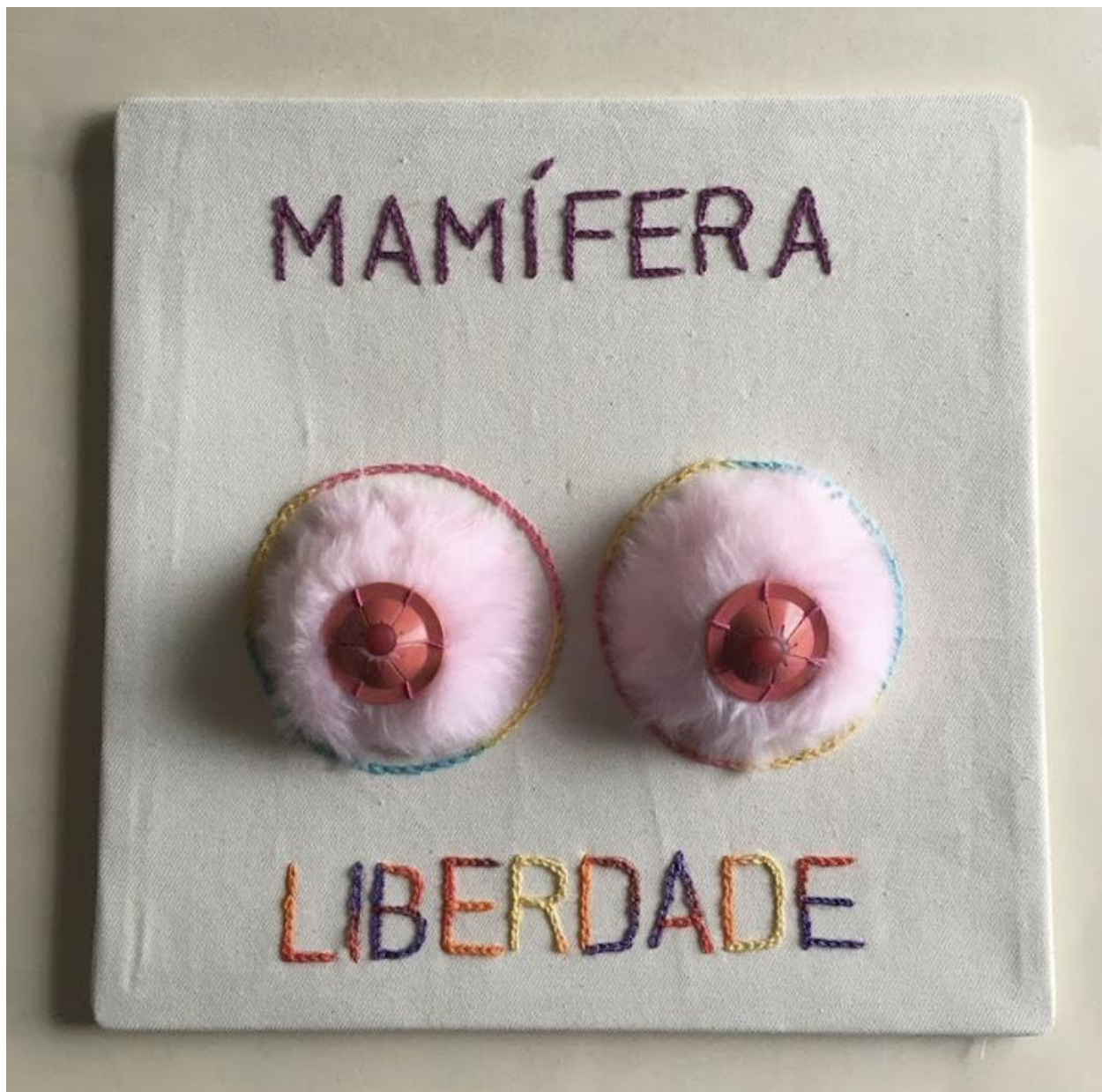
Delfina Reis. Mamífera, liberdade. Bordado. Linha, pelúcia, plástico pintado. 30 x 30 cm 2021