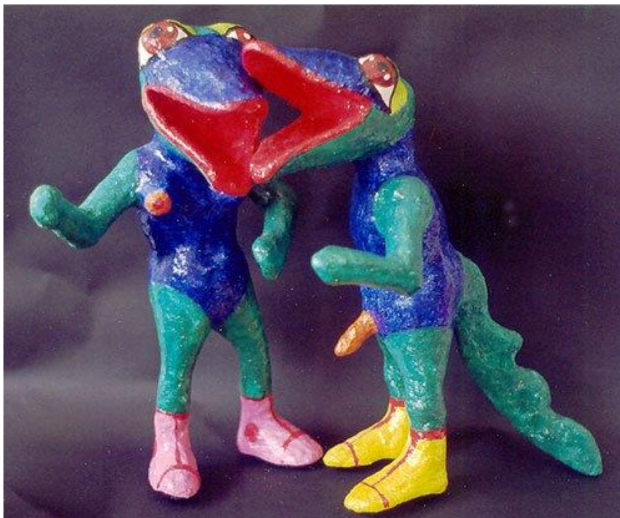
Delfina Reis. Casal de Bichossauros pintado com tinta acrílica.. Escultura em papier maché 50 x 40 x 29 cm. Anos 90.