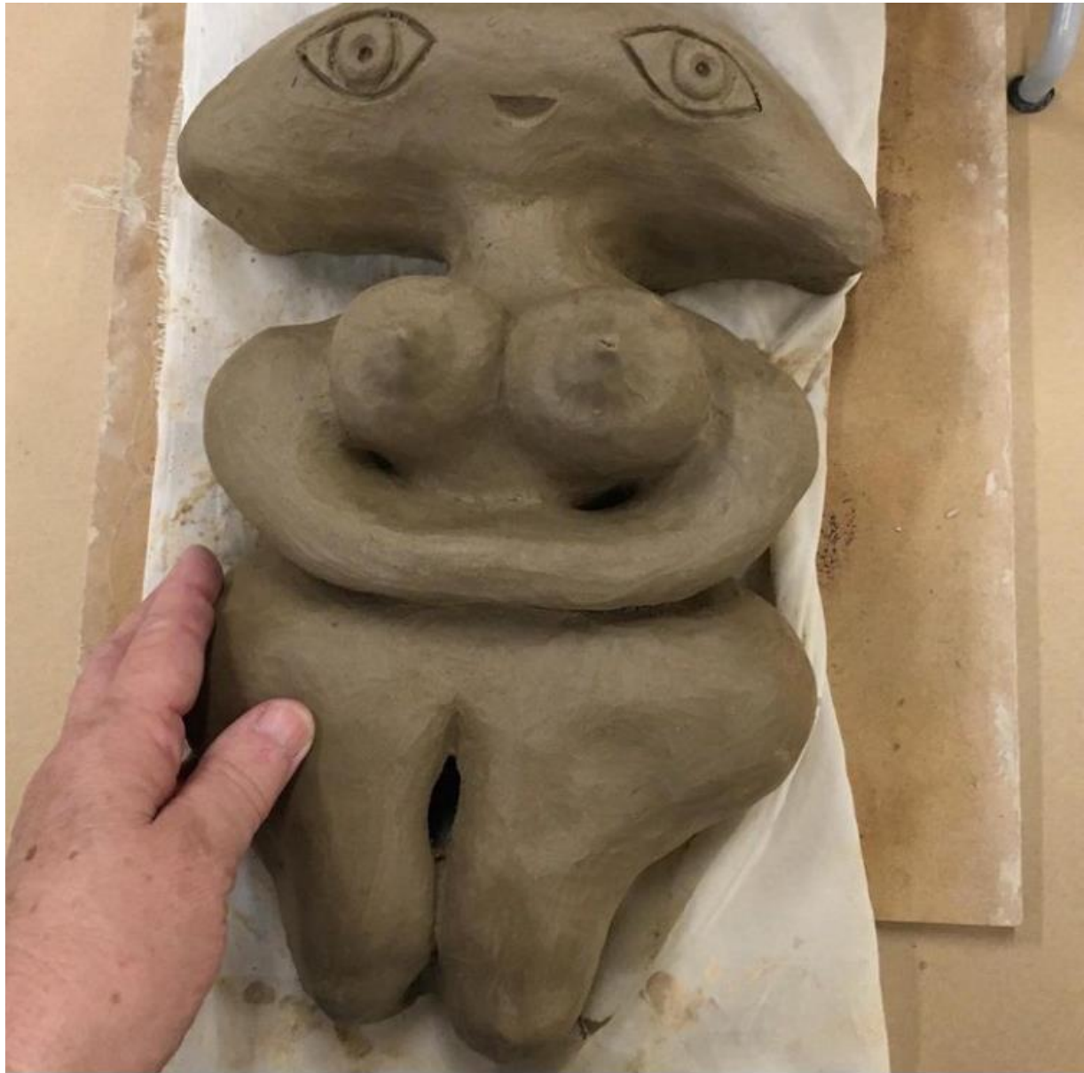
Delfina Reis. Vênus E. T. Escultura em argila ( Cerâmica) 32 x 21 x 9 cm. 2022.